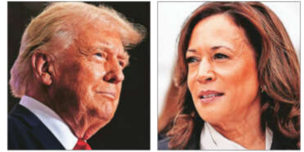
The team of Kamala Harris (right) had previously agreed to a debate with ABC News on September 10

REPUBLICAN PRESIDENTIAL NOMINEE Donald Trump looked to recapture attention in his race against vice president Kamala Harris on Thursday, dangling a series of debates and fielding questions for over an hour from reporters at his Mar-a-Lago resort.