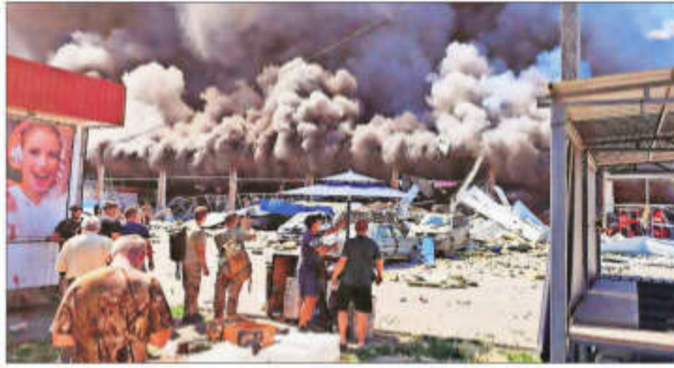
A view shows a mall damaged in a Russian military strike in Kostiantynivka, Donetsk region, Ukraine on Friday

RUSSIA DECLARED THE situation in the Kursk region a "federal level" emergency and sent reinforcements there on Friday, four days after hundreds of Ukrainian troops poured over the border in what appeared to be Kyiv's biggest attack on Russian soil since the war began.